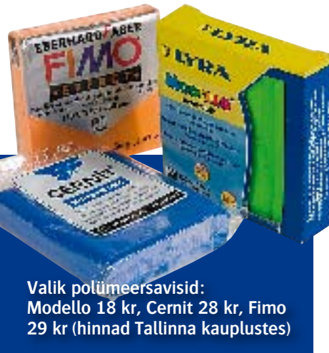
Valik polümeersavisid: Modello 18 kr, Cernit 28 kr, Fimo 29 kr (hinnad Tallinna kauplustes)

Tekst ja fotod: Daisy Lappard Täname: www.hobipunkt.ee